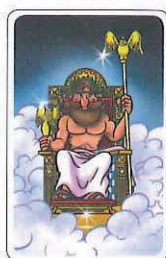
Carta Primo giocatore